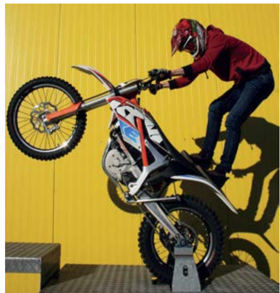
Le „Simulateur-Wheelie“ avec le KTM Freeride est un accroche-regard bien particulier.

L'exposition spéciale ALL ELECTRIC, mise sur pied par NewRide sur mandat de SuisseEnergie et avec le soutien de l'Office fédéral de l'environnement (OFEV), se trouve cette année en place vedette, directement à l'entrée de Swiss-Moto (stand F20). Douze deux-roues électriques différents peuvent être testés sur le réseau routier public. Avec un peu de chance, votre visite du stand coïncidera avec l'apparition d'un EXTRIX E-Scooter de Domino's Pizza transportant des pizzas à l'intérieur de son coffre volumineux. Sur le „Simulateur-Wheelie“ vous pouvez tester votre équilibre: lors de toute la durée de Swiss-Moto, qui parviendra à se maintenir le plus longtemps sur la roue arrière? De magnifiques prix attendent les trois meilleurs as de l'équilibre qui l'emporteront. La palette d'E-Scooter a gagné en couleurs. Qui vous