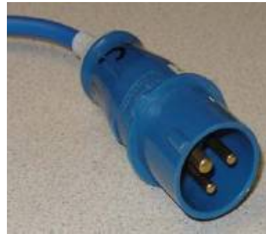
CEE16 16 A, 1- phasig 230V