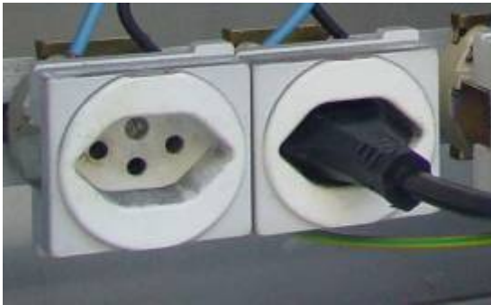
T13 10 A oder 16 A, 1- phasig 230V