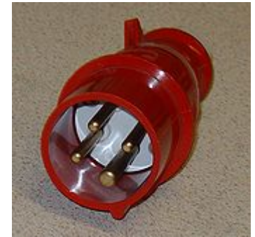
CEE16 32 A, 3- phasig 400 V