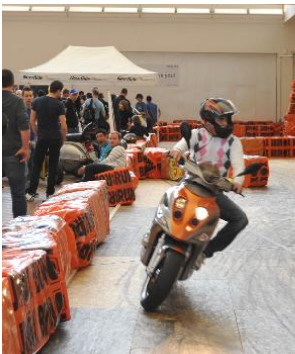
ALL ELECTRIC in Halle 7: Dieses Jahr wieder mit Testparcours.